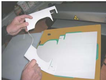
Retirar los restos