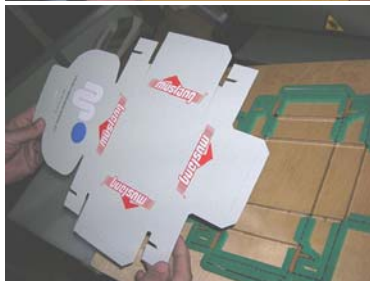
Material troquelado según la figura del troquel