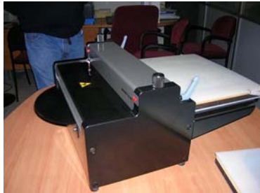
Salida del troquel por la parte posterior