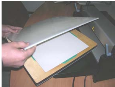
Retirar la sufridera del troquel