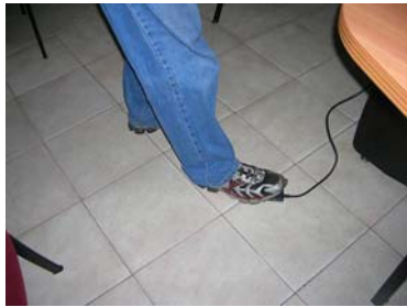
Accionar el pedal